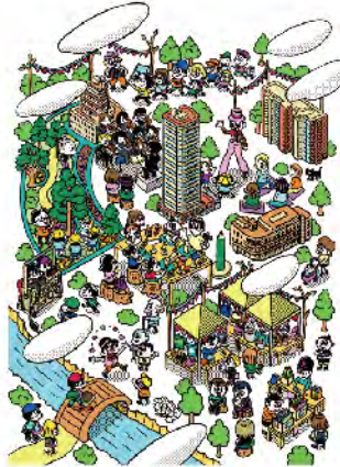
カバーイラストレーション：タナシキコロ

戦後に川が埋め立てられるまで、その地名の通り島だった江之子島。明治時代には、大阪府庁舎が立つ行政の中心地であり、貿易港として対岸の川口に外国人居留地を擁する文化の発信地でもありました。そんな歴史を持つ江之子島に、「江之子島地区まちづくり事業」再開発により、「大阪府立江之子島文化芸術創造センター(enoco)」と「阿波座ライズタワーズ マーク20/フラッグ46の2棟のマンション、そして「日本生命病院」が建つ新しいまちが完成しました。まちのコンセプトは「Art & Life〜めぐりのまち、えのこじま(A&L)」。アートの刺激に触れて思考をめぐらせたり、ワークショップで身体を動かし血のめぐりを良くしたり、再開発が進む大阪西エリアをめぐるとの拠点にしたり…。かつて港として栄えたこの地域で、文化と文化、人と人がめぐり合うまちを目指しています。